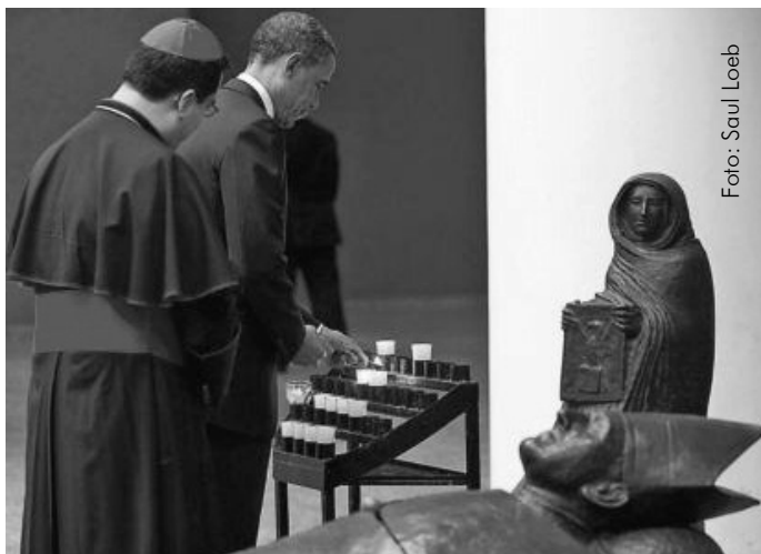
Obama am Schrein von Bischof Romero

So stand Obama schließlich im Palacio de la Moneda , Santiago de Chile, wo eine leidenschaftliche Rede wohl auf fruchtbaren Boden gefallen wäre, wo er die maßgebliche Mitverantwortung der USA für die finstersten Jahre Chiles, die gerade hier ihren Ausgang genommen hatten, doch wenigstens hätte andeuten können. Stattdessen wurden leere Wort-