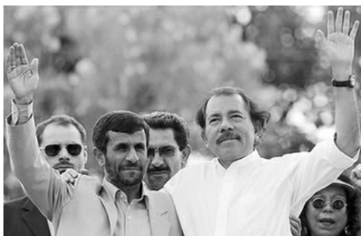
Daniel Ortega mit seinem „guten Freund“ Ahmadinejad