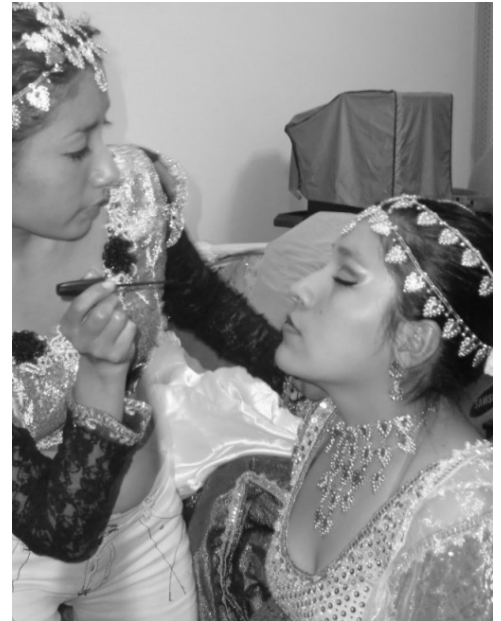
Verwandlung vor einer Tanzinszenierung

Neben Fankunst spielt vor allem der Tanz eine wesentliche Rolle, der von den Jugendlichen im Rahmen der Filmrezeption mit akribischer Genauigkeit einstudiert, präsentiert, aber auch adaptiert wird. Pro Jahr finden vor allem in Lima zahlreiche Inszenierungen vor Publikum statt, bei denen auch Schmink- bzw. Verwandlungsszenarien als intensive Aneignungsprozesse genannt werden können. Im Rahmen der Tanzveranstaltungen steht allerdings weit weniger die Kopie der filmischen Tanzszenen als meist das kreative